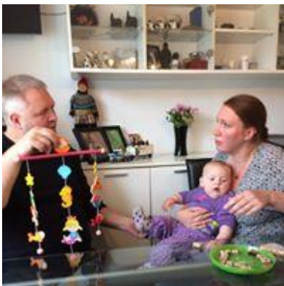
En politiker i sit rette element ;o) i praktik hos en Home-Start familie.