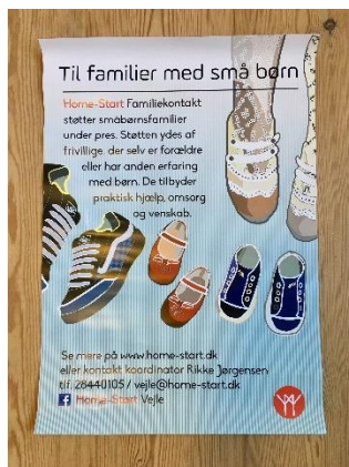
Plakat der hænger rundt omkring, fx i daginstitutioner

Helt konkret består dette samarbejde med faggrupperne i, at de deler vores kort ud, fortæller familierne om os og hænger vores plakater op. Flere familier har fortalt, at de har set et opslag fx i børnehaven.